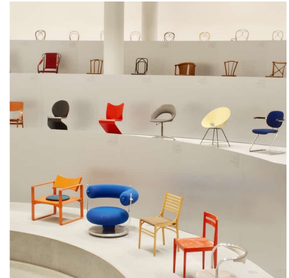
Pinakothek der Moderne